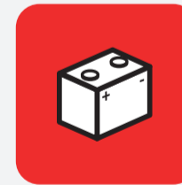
Batteries de voiture Car battery

Votre objet ou mobilier est en bon état ? Contactez la Ressourcerie Du Pays de Gex