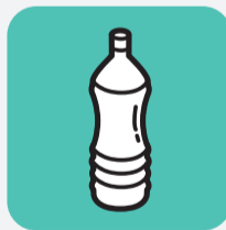
Huiles végétales Vegetal oils