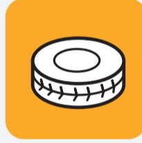
Pneus véhicules légers (sans jante) Light vehicle tire (without rim)