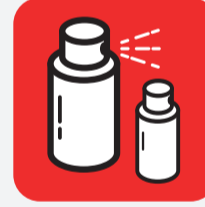
Produits ménagers dangereux (peinture, solvants, pesticides) Hazardous household products