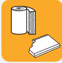
Autres encombrants non recyclables Glass wool, glass, plaster