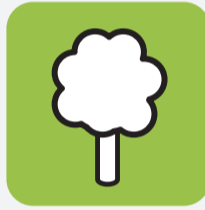
Déchets verts Green waste