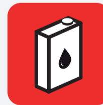
Huiles de vidange Motor oils