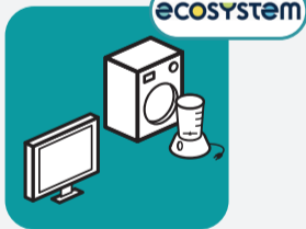
Électroménager, appareils électriques et électroniques Household appliances, electrical and electronic devices