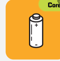
Piles / batteries Battery