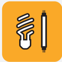
Lampes / néons Lamps / Neons